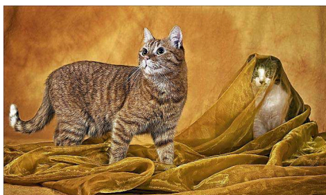
„Katzenharem“ nennt Klaus-Peter Selzer sein Foto.

◆ Die 150 besten Werke sind ab Samstag, 9. April, 16 Uhr, im Bildungszentrum der Arbeitskammer in Kirkel zu sehen.