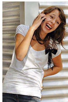
Das Bild ist Teil der Serie „Gute Nachrichten“ von Ann-Sophie Edinger.