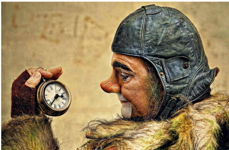
„Wer hat an der Uhr gedreht“ – so nennt Saarlandmeisterin Isolde Stein-Leibold ihr Foto.

Saarländische Fotomeisterschaft! Rund 700 Bilder wurden eingereicht, die besten hat eine Jury prämiert. Ab 9. April sind die 150 besten Bilder der Saarländischen Fotomeisterschaft in Kirkel zu sehen.