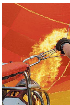
Steffen Klos reichte die Serie „Heißluftballon“ als Wettbewerbsbeitrag ein.