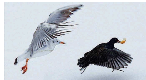
Tanja Zech war mit ihrem Bild „Futterdieb“ erfolgreich.