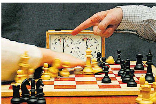
„Die Zeit ist abgelaufen“, so heißt dieses Foto von Wolfgang Ballof, es erhielt 26 Punkte.